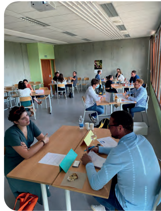
Job Dating juin 2023